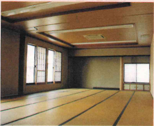
和室1 及び 和室2